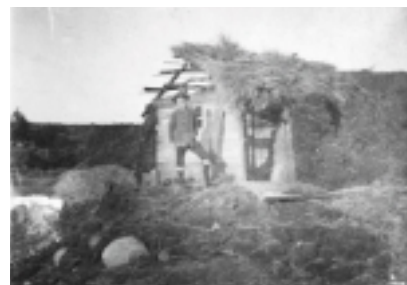
Den første hytte ved Trollesminde, ca. 1909. Hytten lå i en grusgrav ved Trollesminde-gården.

Hytten ligger på en stor, kuperet grund, som er stillet til rådighed af Hillerød Kommune. En ideel basis for godt spejderarbejde og beliggende tæt ved skov.