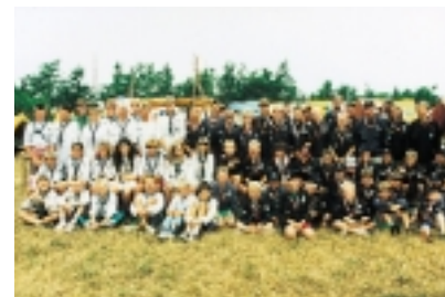
Gruppen 1994 sammen med Solberg gruppe fra Norge. Troppen besøgte gruppen året efter.

Hilde Gurkas-klanen er arrangør af den årlige landsturnering for seniorspejdere - Sværdkampen. I terrænet ved Frydenborg deltager over 100 seniorspejdere i det store arrangement, som klanen får stor og velfortjent ros for.