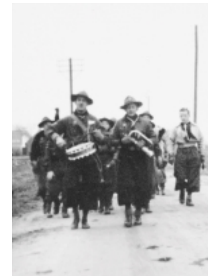
"Den gamle C4 tromme" på tur med troppen.