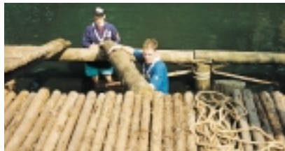
Rampen bygges af elmaster og 12 mm tovværk.

Resten af gruppen er på sommerlejr på Fyn.