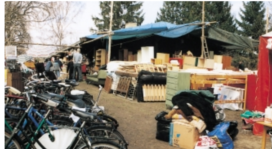
Loppemarkede i C4 er blevet et stort tilsløbsstykke, med over 500 besøgende i 2000.