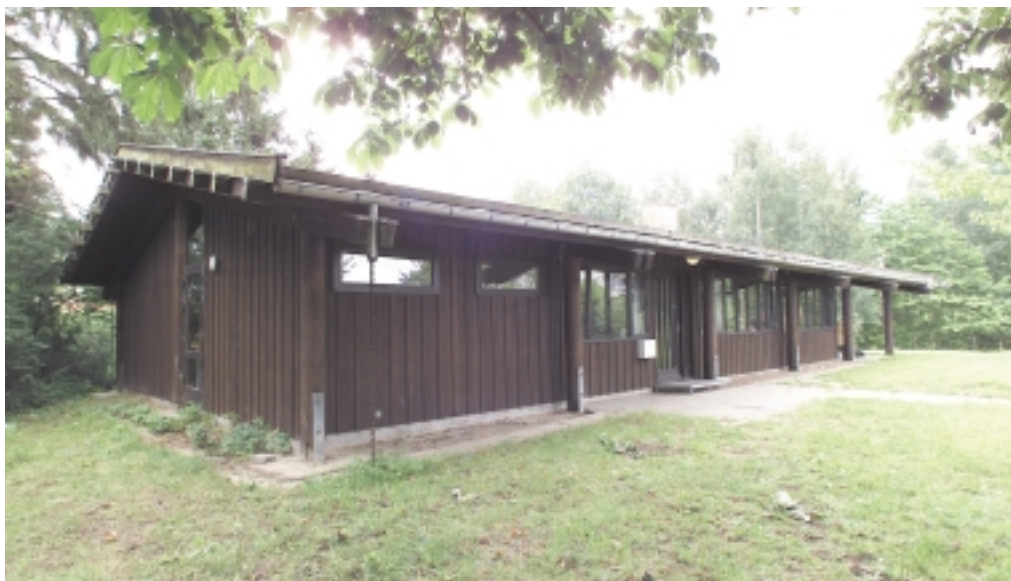
Kulsvierhytten på Poppelgangen. Ramme for tusind af spejdertimer hvert år.

Kulsvierhytten er navnet på C4's nuværende spejderhytte og mødelokaler på Poppelgangen i Hillerød. Hytten er på ca. 160 m 2 og blev indviet i 1972.