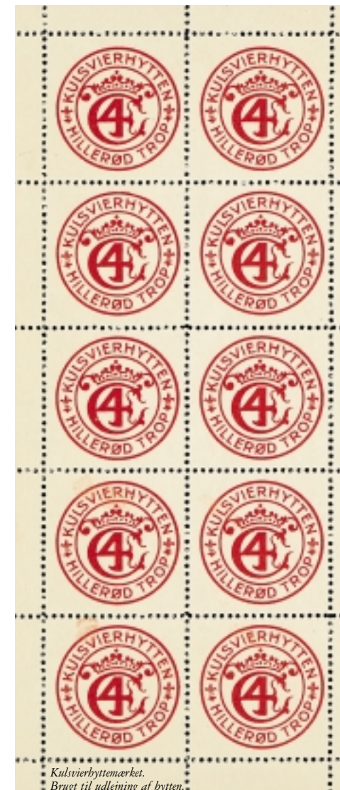
Kulsvierhyttmærket. Brugt til udlejning af hytten.

Desværre holdt hytten kun til sommeren 1936, hvor den brændte ned.