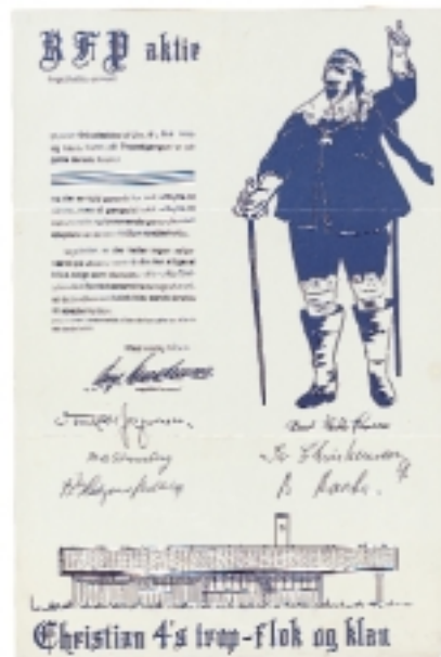
Tilskudsaktien RFP aktien. RFP stod for "Riget Fattes Penge". Aktien lovede fuld garanti for nul udbytte til ejeren og fuldt udbytte til spejderne i C4.

Også ved dette byggeri var der økonomiske trængsler, og der blev tegnet "tilskudsaktier", hvor det bl.a. var anført, at "der er fuld garanti for nul udbytte til ejeren, men til gengæld fuldt udbytte til nuværende og kommende generationers spejdere af denne dejlige spejderhytte."