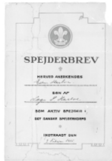
Spejderbrevet fulgte spejderen gennem hele spejdertiden.