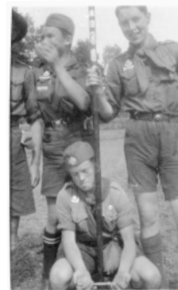
Stockholm 1927. De svenske spejders jubilæumslejr.