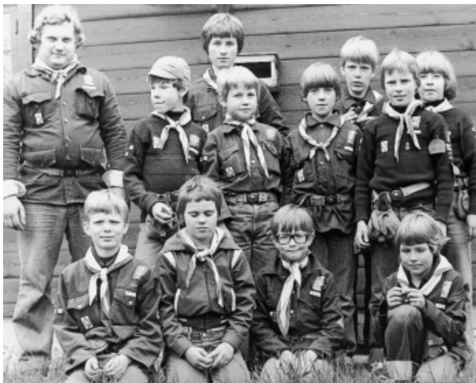
Ulveflokken 1980, til bålaften på Frydenborg.