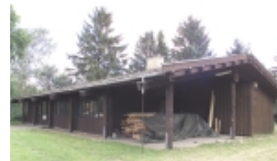
Til renoveringen af hytten blev der brugt 170 m 2 brædder.

I slutningen af 90'erne opstod ønsket om en hovedrenovering af hyttens indvendige beklædning. Den var blevet slidt og hytten fremstod ikke i den stand som ledere og styrelse ønskede.