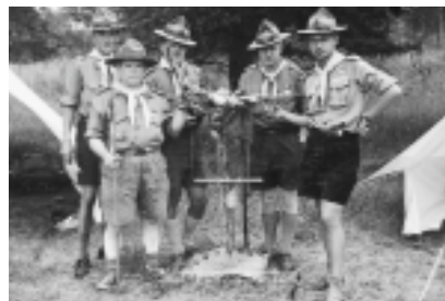
Gilwill patruljen "Tyrene", med "q" som nr. 2 fra venstre.

"q", der udtales "lille q", blev spejder i 1. Hillerød Trop i 1920, og han var aktiv spejder i flere menneskealdre. Han deltog i mere end et halvt hundrede lejre og jamboreer. Blandt andet var han en af de 5 C4-spejdere, der i 1926 deltog i jamboreen i Ungarn, og ved denne lejlighed blev "q" verdensmester i træklatring.