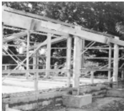
Hytten genopføres i 1972. Finansieret af tilskudsaktier.

Endnu en gang trådte kommunen hjælpende til og stillede den nuværende grund på Poppelgangen til rådighed, og i november 1936 kunne man indvie en ny Kulsvierhytte. Under besættelsen beslaglagde tyskerne hytten, og den var noget medtaget, da C4 fik rådighed over den igen i 1945. Den blev sat i stand og blev samlingssted, ikke blot for C4, men også for Frederiksborg Trop, der var dan-net i 1942 ved en deling af C4. I 1947 dannedes yderligere en trop og en flok, Herluf Trolles Trop og Flok, som også benyttede Kulsvierhytten. Med basis i Herluf Trolles og Frederiksborg Trop dannedes i 1962 Frederik den 2. Trop. De fandt senere andre lokaler, men på et tidspunkt var der 3 troppe og 3 flokke, der skulle deles om hytten. Der var ingen patruljelokaler, så derfor foregik det meste af patruljearbejdet andre steder, f.eks. hjemme hos patrulje-medlemmerne.