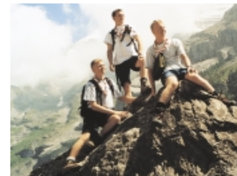
C4 er en aktiv gruppe med traditioner og fornøjelse.

90 år er lang tid at se tilbage. Tilblivelsen af dette jubilæumsskrift er sket med hjælp fra en række "gamle" C4-spejdere, som har bidraget med fortællinger. Det har suppleret C4-historien, som vi syntes var godt beskrevet i tidligere jubilæumsskrifter, men det har også afsløret, at mange facetter af C4-fortiden mangler at blive fortalt eller blive registreret og komme med i C4-arkivet.