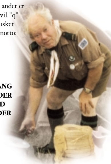
"q" på lejr i 1974.