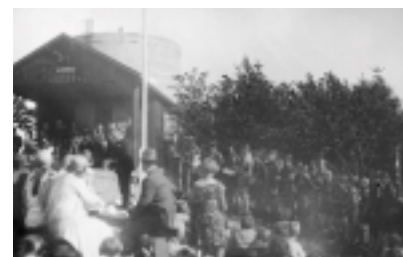
Indvielse af den første Kulsvierhytte ved vandtårnet i 1928.

I 1928 blev den første Kulsvierhytte opført på en grund, som kommunen havde stillet til rådighed ved vandtårnet på Skansevej. Hytten var bygget af jernbanesveller, og det var spejderne selv, der stod for byggeriet.